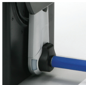
Farbige LEDs zur Statusanzeige des Aufwicklers