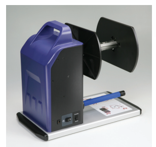
Modernes, funktionelles Design in robuster Ausführung