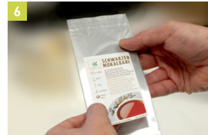
6 Fertiges Etikett anbringen.