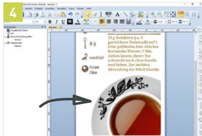
4 Metallic-Elemente mit Etiketten-Software gestalten.