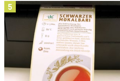
5 Etikettendruck starten.