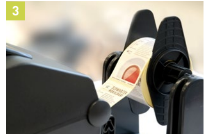
3 Bedruckte Etikettenrolle in den Foliendrucker einlegen. Für Rollen mit großem Außendurchmesser liegt ein externer Abwickler bei.