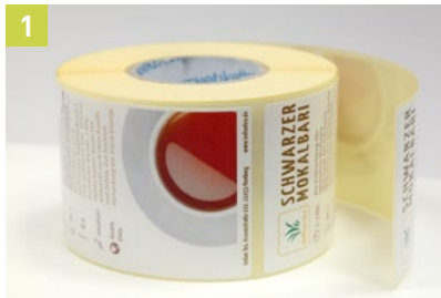
1 Farbeticket entwerfen und nach Bedarf mit einem Farbdruker drucken (z.B. Epson C3500).

In wenigen Schritten ihre Farbetiketten individuell veredeln.